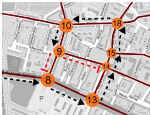
Rys. 1.2. Przypadek w którym mrówka nie może kontynuować podróży (mapa: http://osmapa.pl/ )

Fig. 1.2. The case in which an ant cannot continue the journey (map: http://osmapa.pl/ )