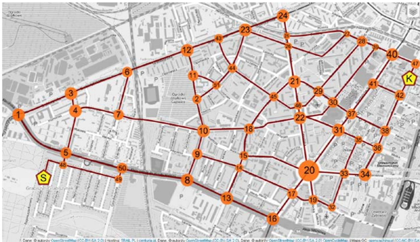
Rys. 1.3. Fragment planu miasta z naniesionymi węzłami komunikacyjnymi (mapa: http://osmapa.pl/ )

Tradycyjny system nawigacji wyznaczył statyczną trasę przez węzły (tab. 1.1) nie uwzględniając jakichkolwiek